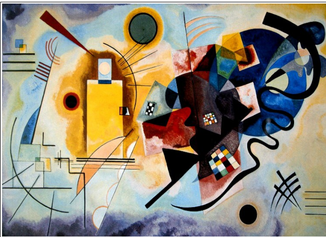
Kandinsky V. Jaune-rouge-bleu (1925)