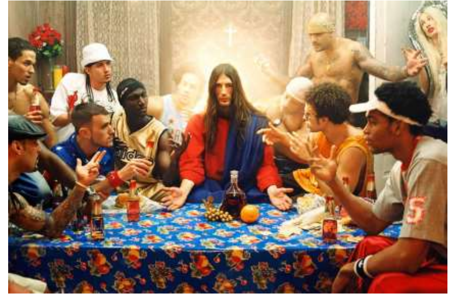
D. LaChapelle (2003) La cène.