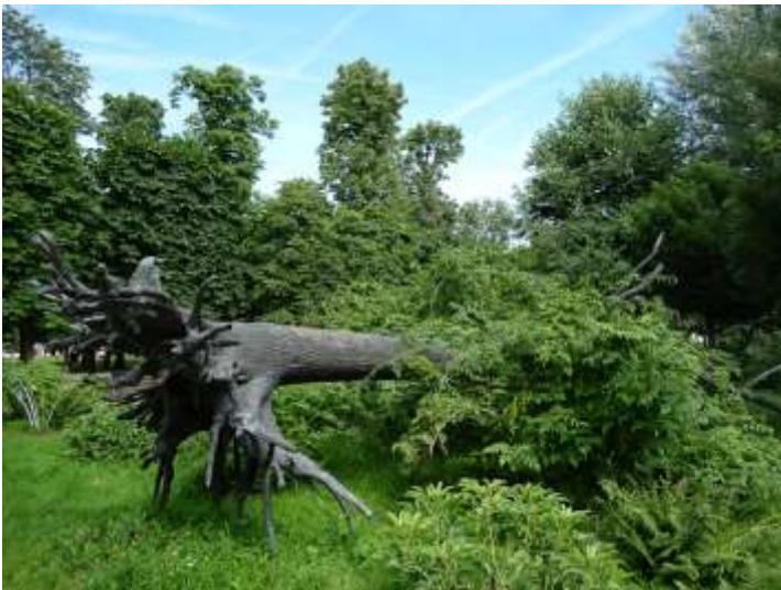
G. Penone. (1999). Arbre des voyelles . Parc des Tuileries Paris