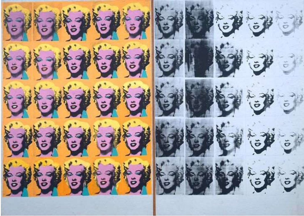
A. Warhol (1962) . Diptyque Maryline Monroe.