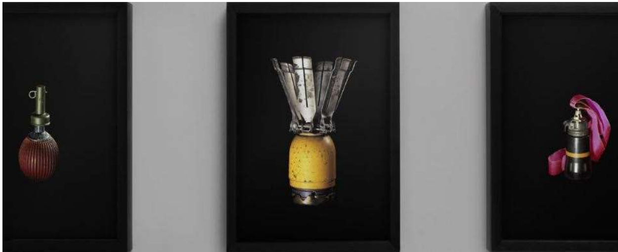
R. Dallaporta. (2004). Antipersonnel (3 photos).