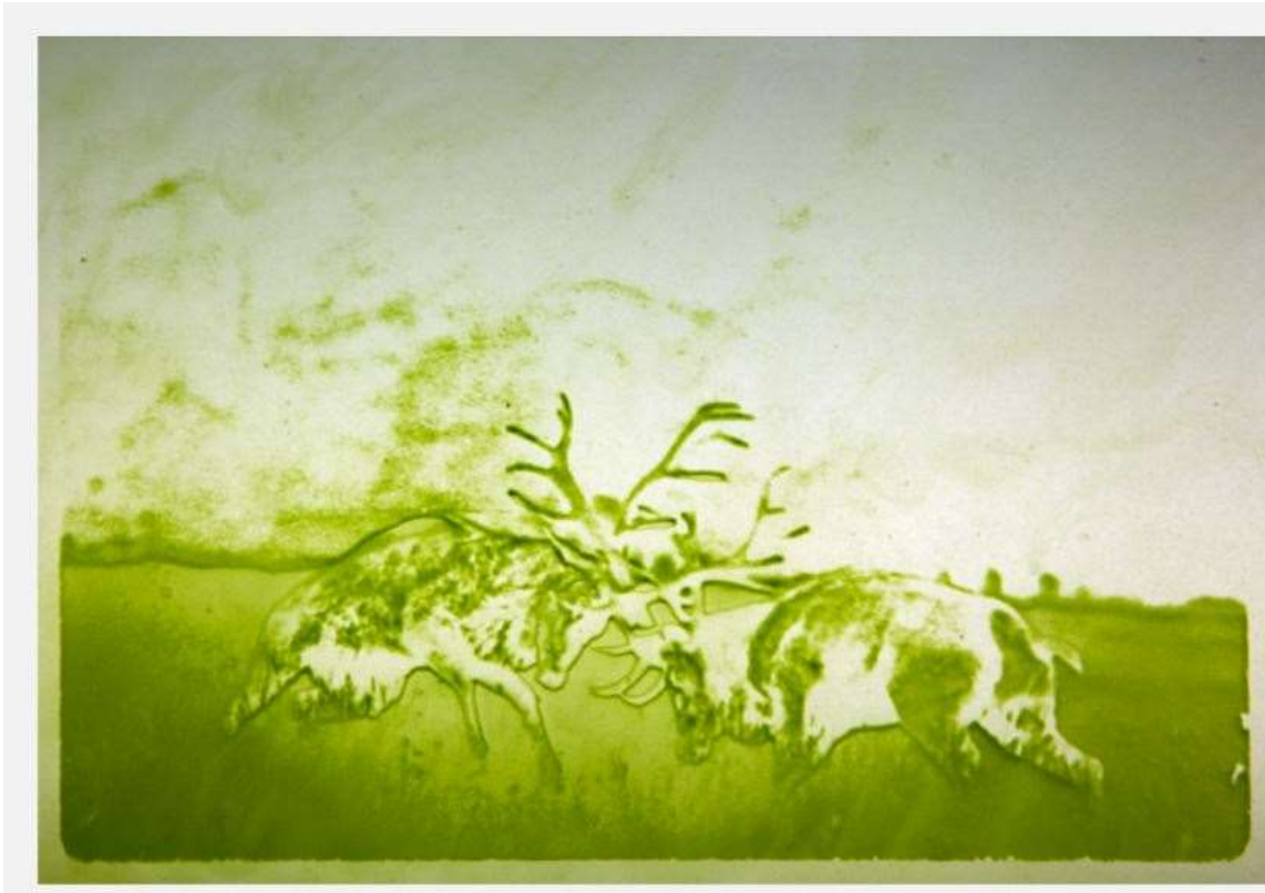
L. Giraud. (2012) Instants suspendus (Extrait)