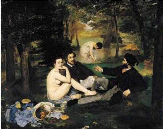
E. Manet. (1863) Déjeuner sur l'herbe