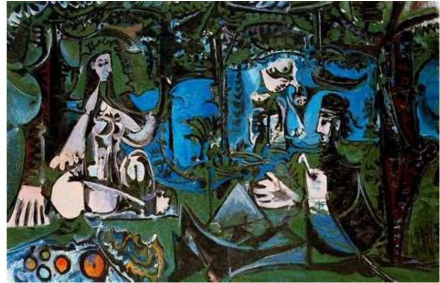
P. Picasso (1960) Déjeuner sur l'herbe d'après Manet.