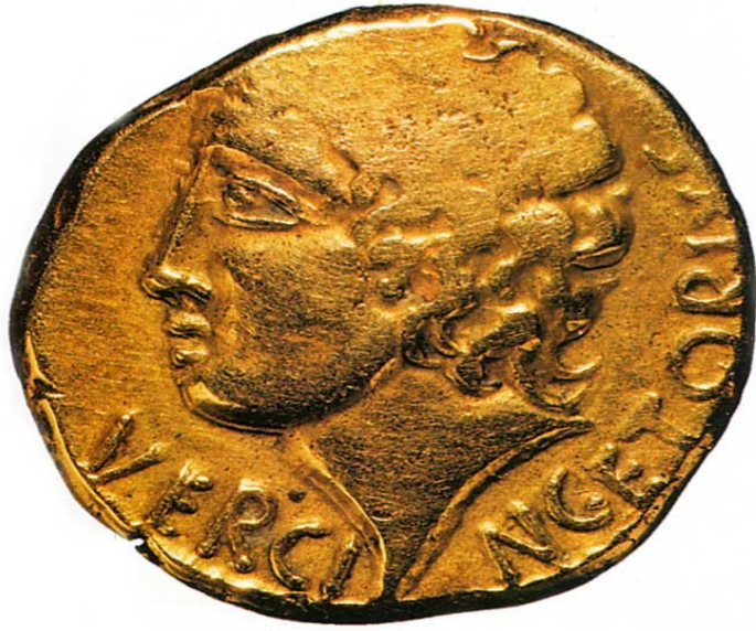
Monnaie frappée à l'effigie de Vercingétorix (1 er siècle avant JC)