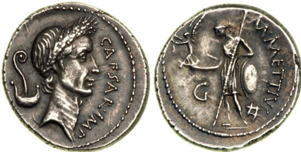
Monnaie frappée à l'effigie de Jules César (1 er siècle avant JC)