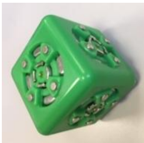
Le vert clair : c'est un fainéant. Il ne sert à rien. On peut l'utiliser pour équilibrer un robot, pour le décorer, pour...

OTHERS : Ils sont uniques et chacun fait quelque chose de différents.