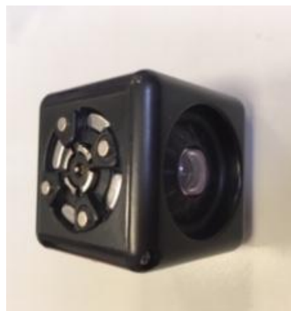
Il détecte la luminosité.

OTHERS : Ils sont uniques et chacun fait quelque chose de différents.