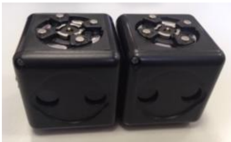
Ils détectent la main ou autre objet placé devant eux.