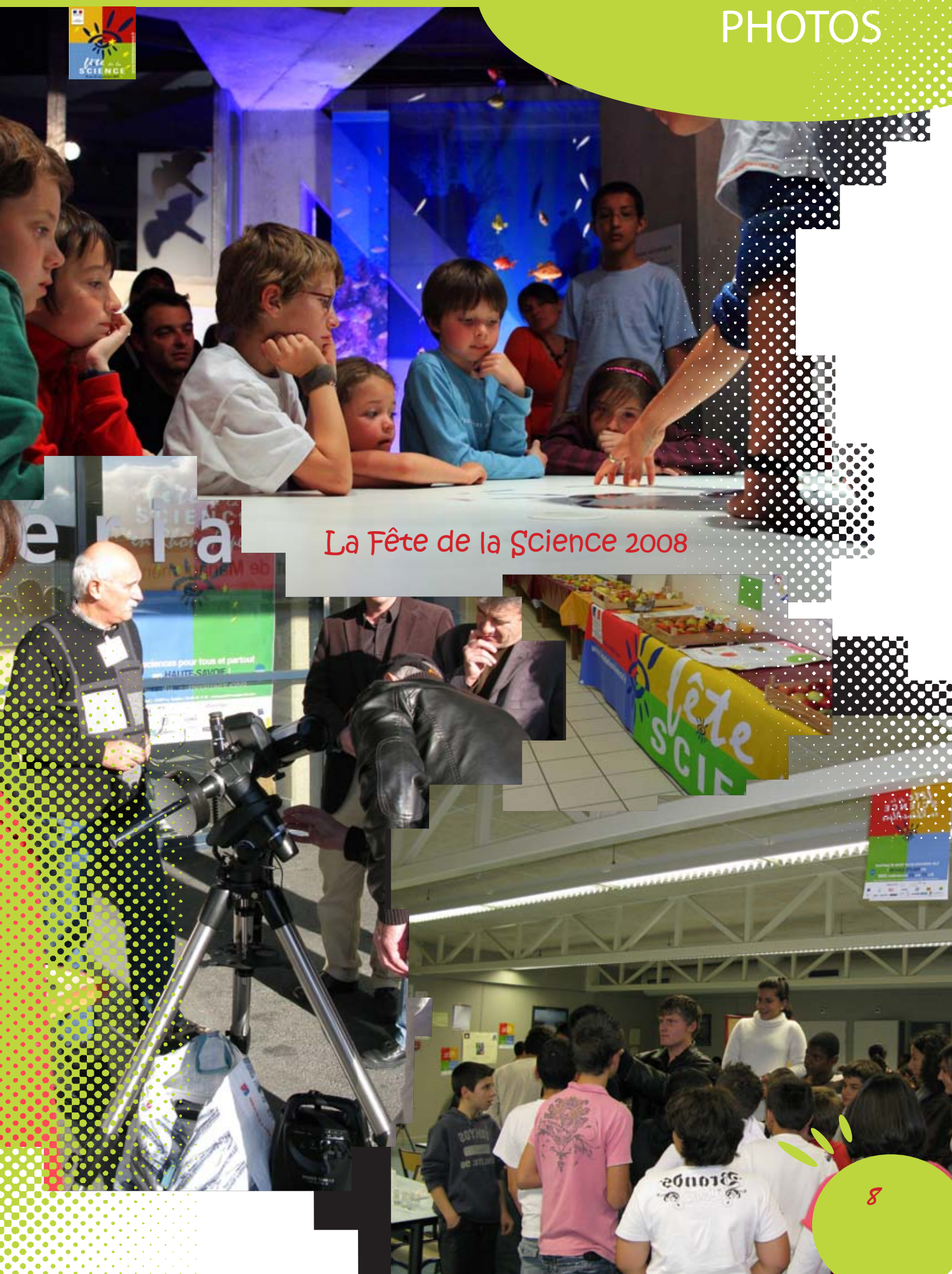
La Fête de la Science 2008