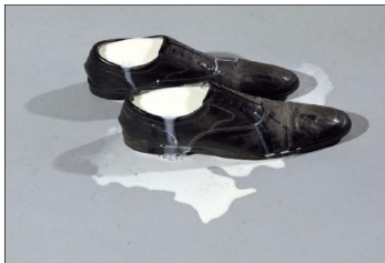
Chaussures de lait