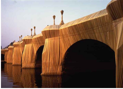
Pont neuf emballé