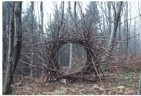
Woven branch circular arch