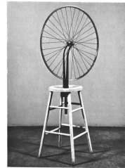
Roue de bicyclette