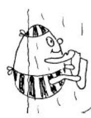
Complètement yeux ouverts