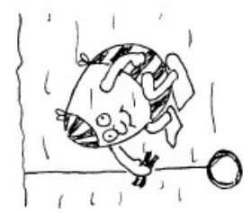
Je prends une pince à linge