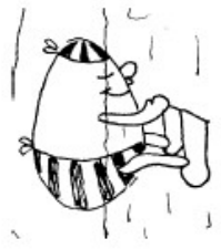
Le bout du nez