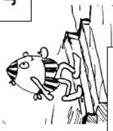
Par les marches