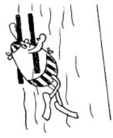
Avec deux frites