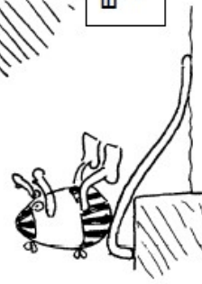
Par le toboggan