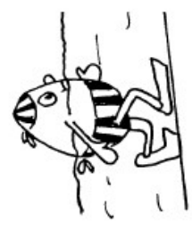
Pieds au fond