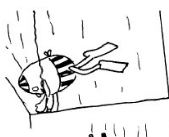
Le long du bord