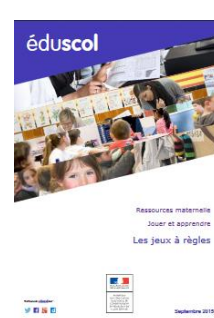
Les jeux à règles