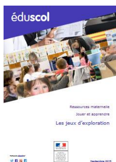
Les jeux d'exploration

De récentes ressources Eduscol, Jouer et apprendre , présentent un descriptif et l'intérêt des différents jeux d'exploration, symboliques, de construction, à règles.