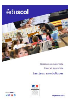
Les jeux symboliques