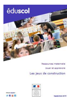
Les jeux de construction