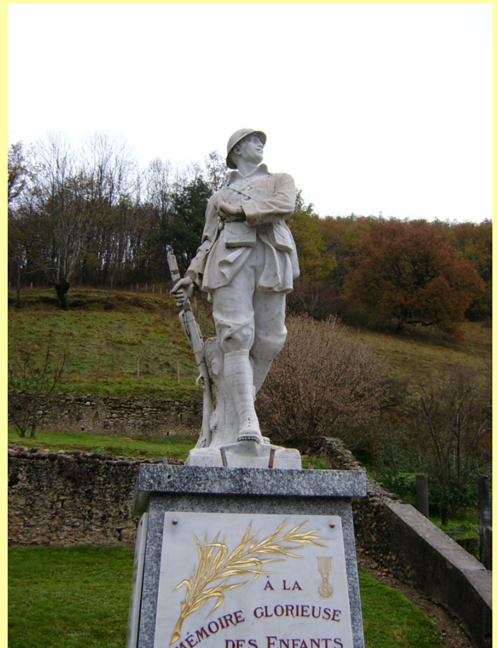
Figure 9 - Monument de la commune de Massieu (type patriotique)