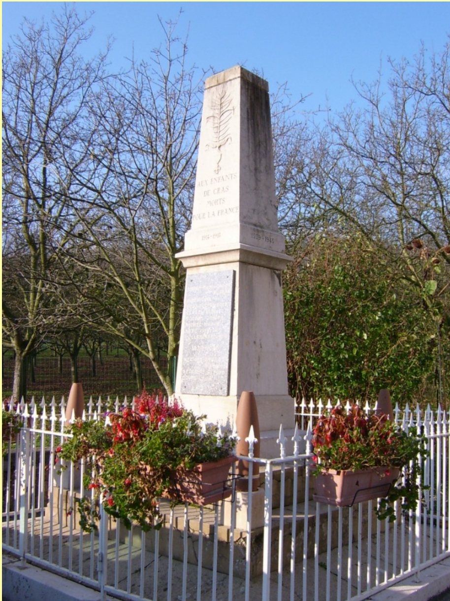
Figure 1 - Monument communal de Cras