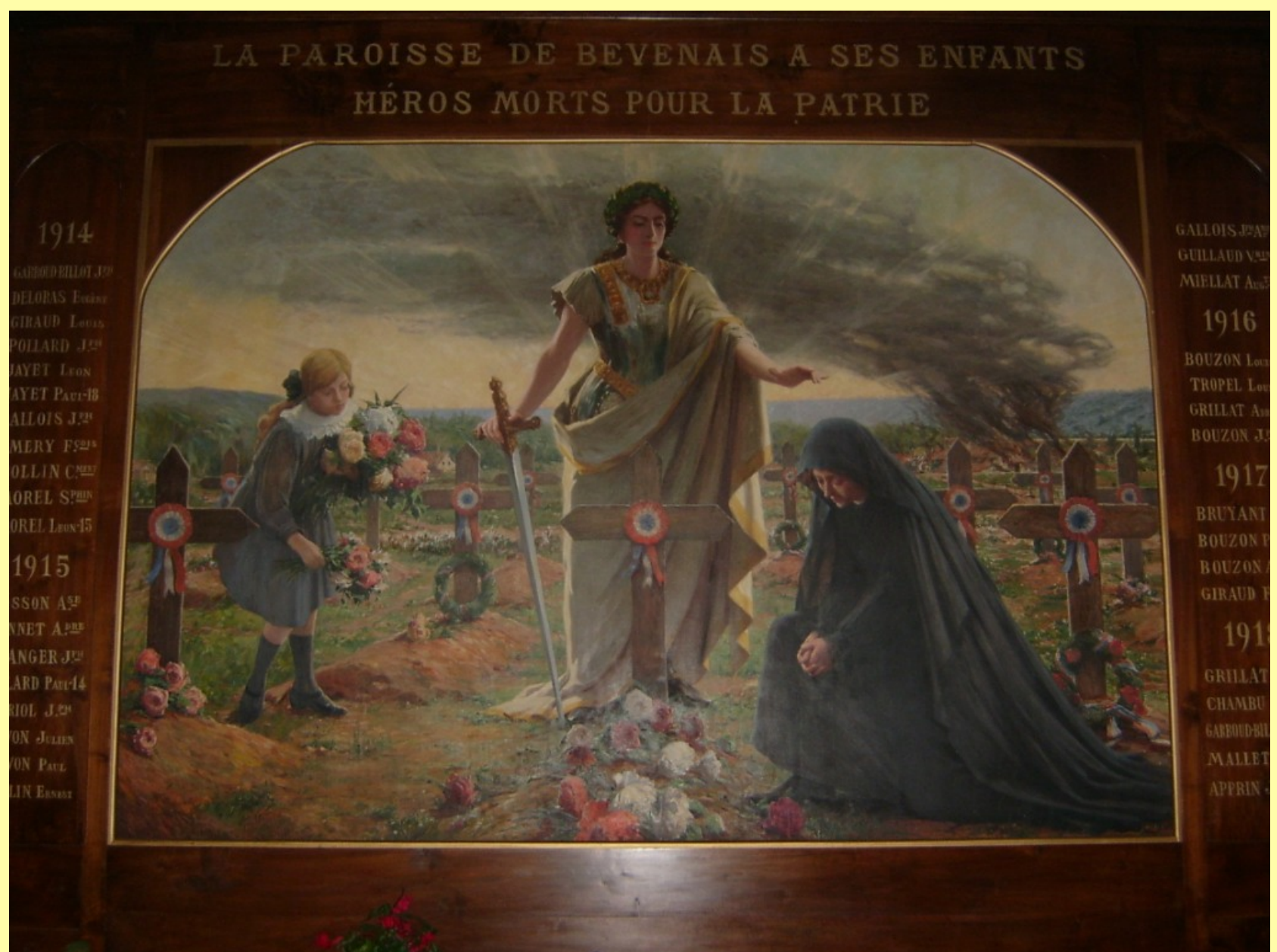
Figure 10 - Monument de la paroisse de Bévenais (type funéraire-patriotique)