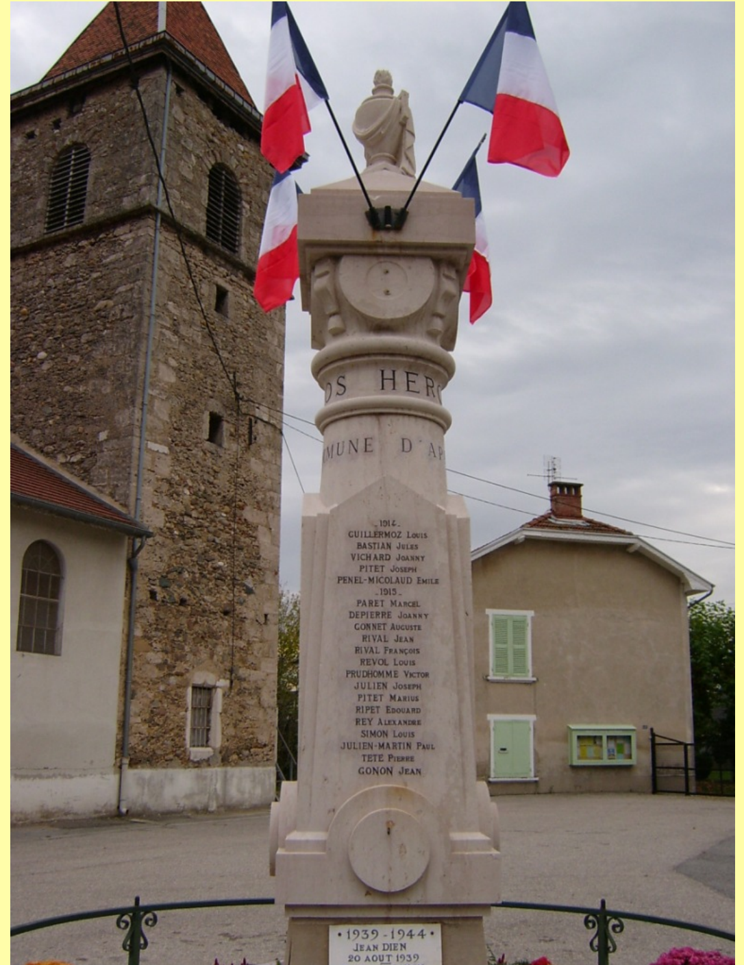
Figure 11 - Monument de la commune d'Apprieu (type funéraire-patriotique)