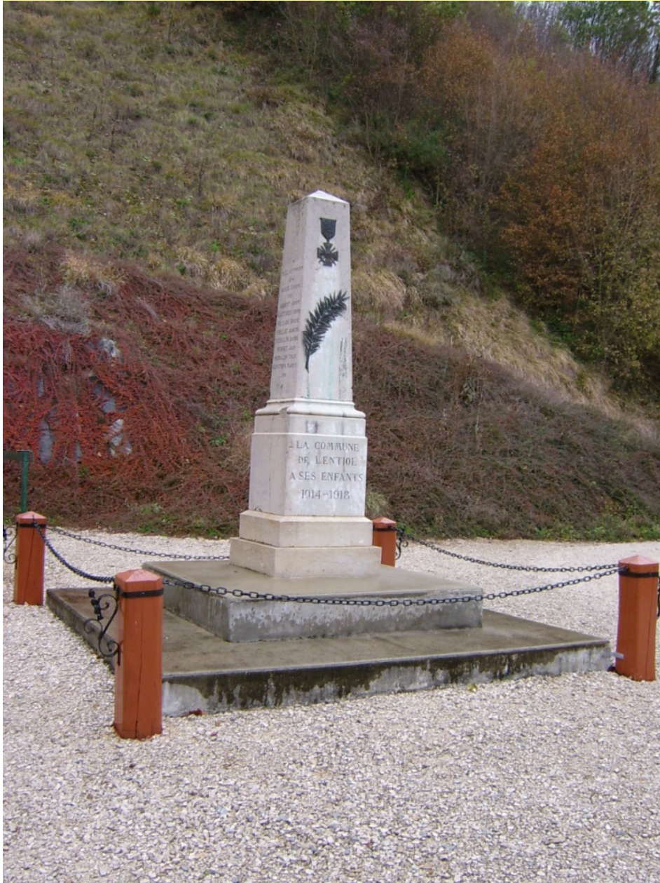
Figure 8 - Monument de la commune de Lentjol (type civique)