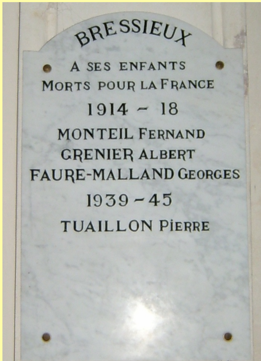
Figure 3 - Monument situé dans l'église de Bressieux