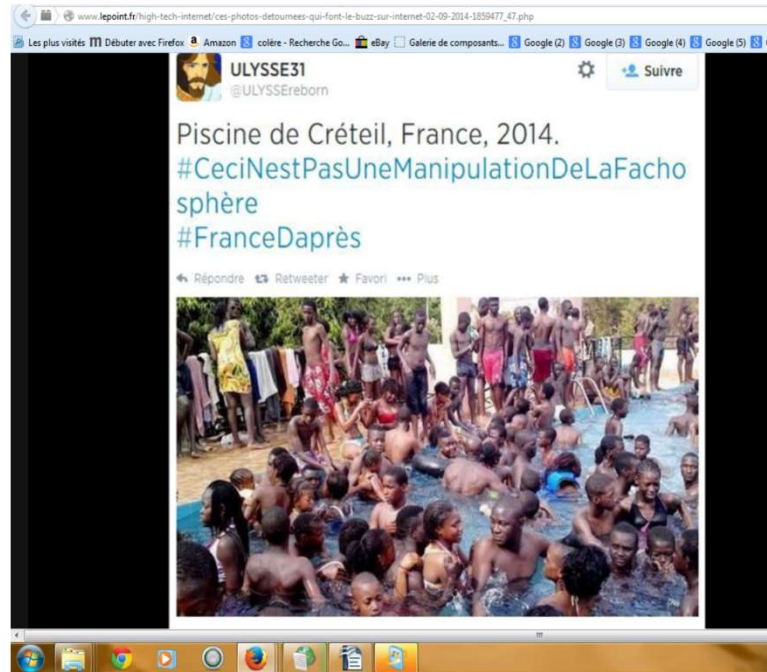
Photo N°2 des hommes et des femmes de couleur en train de nager dans une piscine à Créteil précise la légende ; la piscine est bondée. En fait cette piscine n'est pas située en France mais au Sénégal ! Pourquoi avoir menti sur la légende... Poser la question aux enfants pour leur faire comprendre comment et pourquoi on peut se faire manipuler