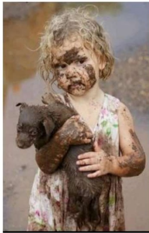
Capture écran de l'enquête de « France 24 » : « Info ou intox, comment déjouer les pièges sur internet ». Photo ayant fait le buzz sur sur Twitter, censée avoir été prise pendant la guerre en Ukraine....